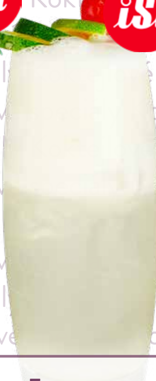
Frozen Lemongrass Fizz

Jodhpur gin, MONIN sirup Citronová tráva, MONIN Rantcho Lemon, bílek, soda, led Náklady: 25,-