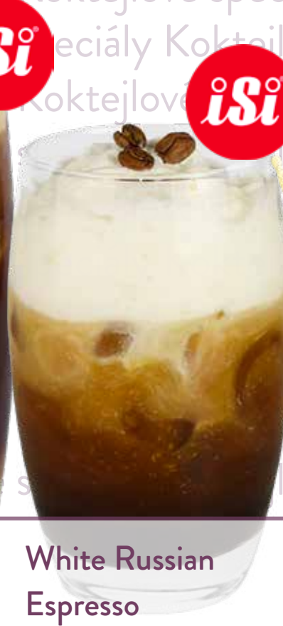
White Russian Espresso

MONIN likér Káva, vodka, espresso, mléko, šlehačka, led Náklady: 32,-