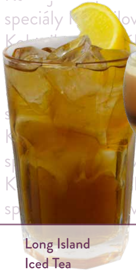
Long Island Iced Tea

Mulata Silver rum, MG Gin, Mezcal Zignum Silver, vodka, MONIN likér Triple Sec Curacao, MONIN Rantcho Lemon, cola, led Náklady: 51,-