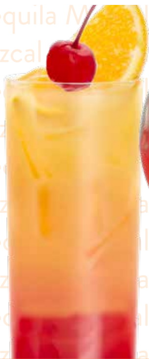
Mezcal / Tequila Sunrise

Mezcal Zignum Silver, MONIN Grenadina, pomaranč juice, led Náklady: 36,-