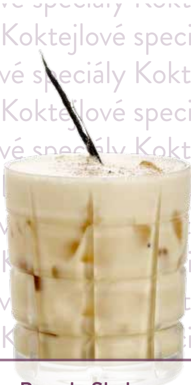
Brandy Shake s příchutí

Brandy Vecchia Romagna, MONIN sirup dle výběru, mléko, led Náklady: 30,-