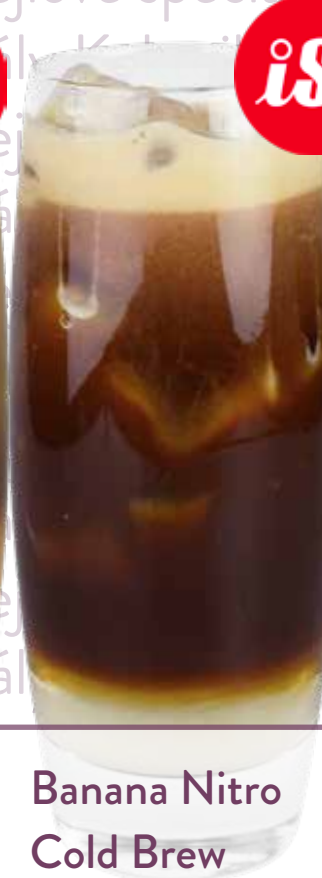
Banana Nitro Cold Brew

MONIN sirup Žlutý banán, cold brew, led Náklady: 16,-