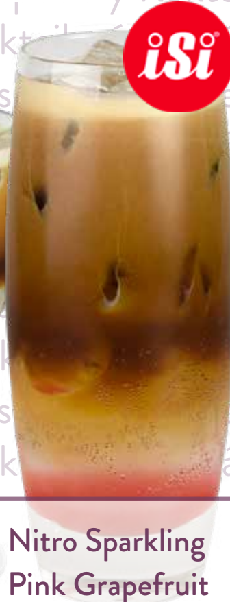
Nitro Sparkling Pink Grapefruit

MONIN sirup Růžový grep, Franklin & Sons Natural tonic, Cold Brew, led Náklady: 19,-