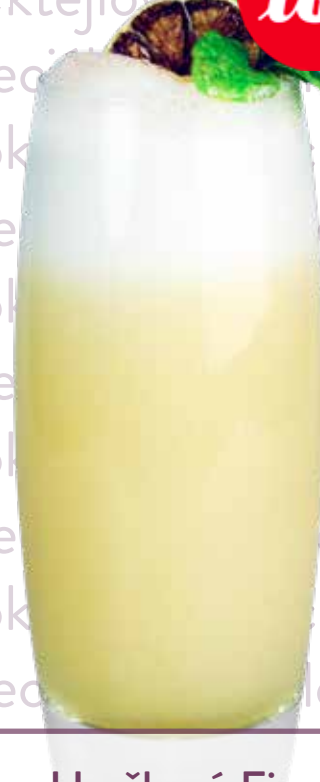
Hruškový Fizz Nitro

Copalli Organic white rum, Cargo Cult Spiced Rum, MONIN pyrè Kiwi, MONIN pyrè Passion Fruit, MONIN Rantcho Lemon, ananas juice, led Náklady: 58,-