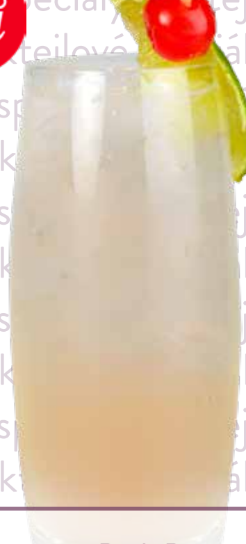
Pink Pepper Fizz

Volcanic Gin, MONIN Rantcho Lemon, MONIN sirup Pepř růžový, soda, led Náklady: 47,-